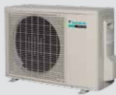
RXS-L / L3