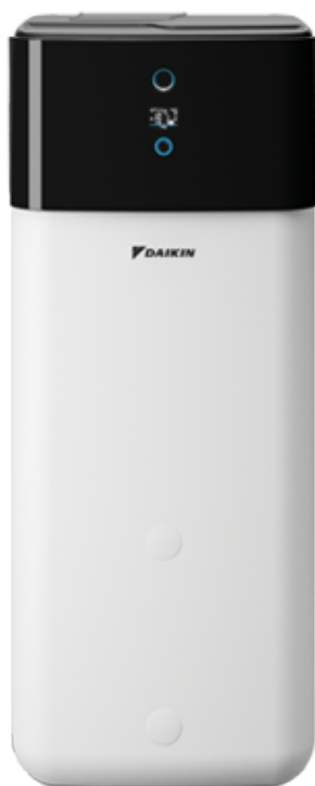
Unidad interior diseño compact