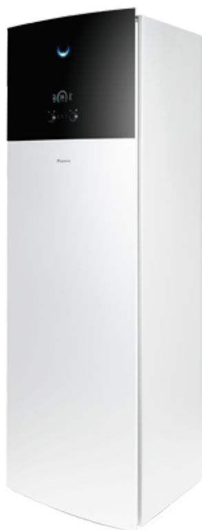
Unidad interior diseño integrado