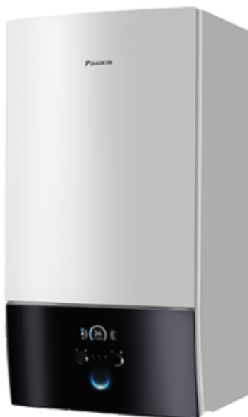
Unidad interior diseño mural