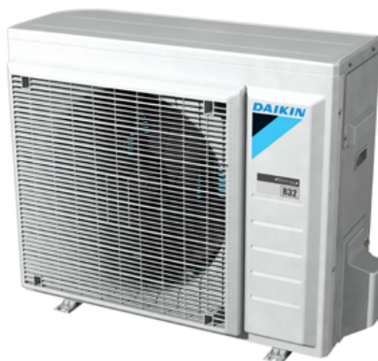
Unidad exterior Bibloc