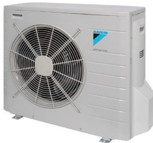
Unidad exterior: EVLQ08CV3