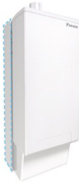
Unidad interior: EHYHBX08AV3